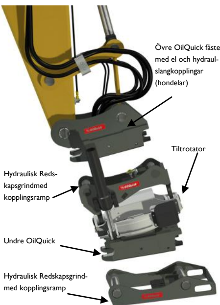
OilQuick kan integreras i de flesta tiltrotatorer på marknaden